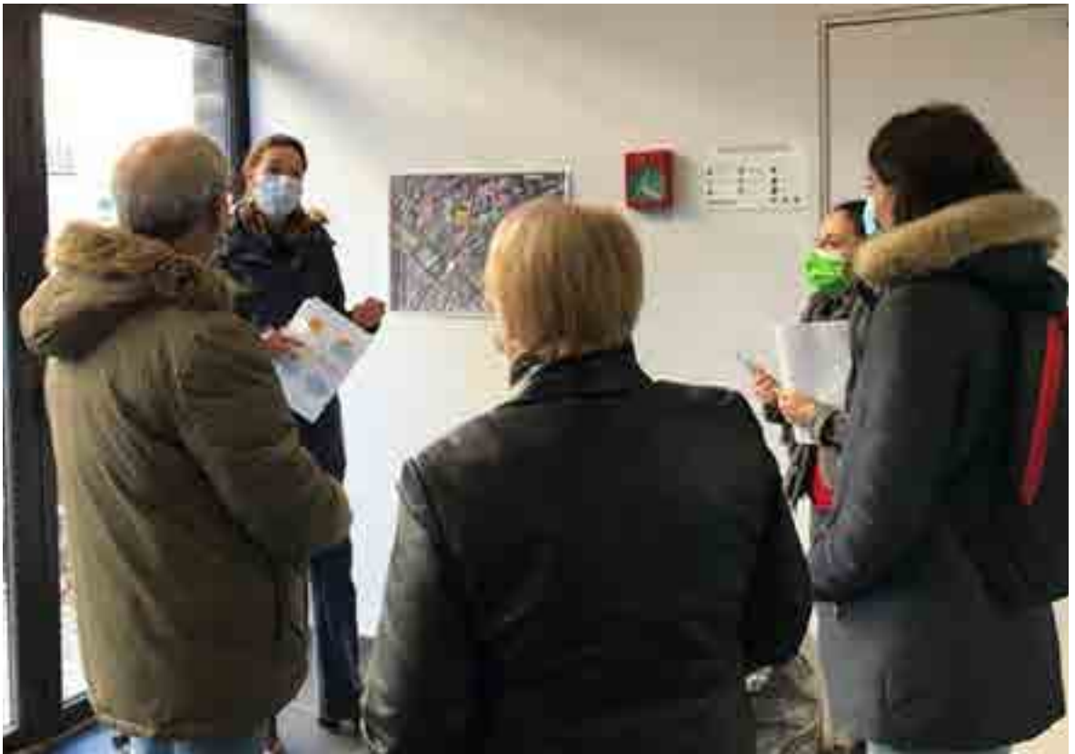
Photographie de la promenade sensible menée avec les habitants en novembre 2021