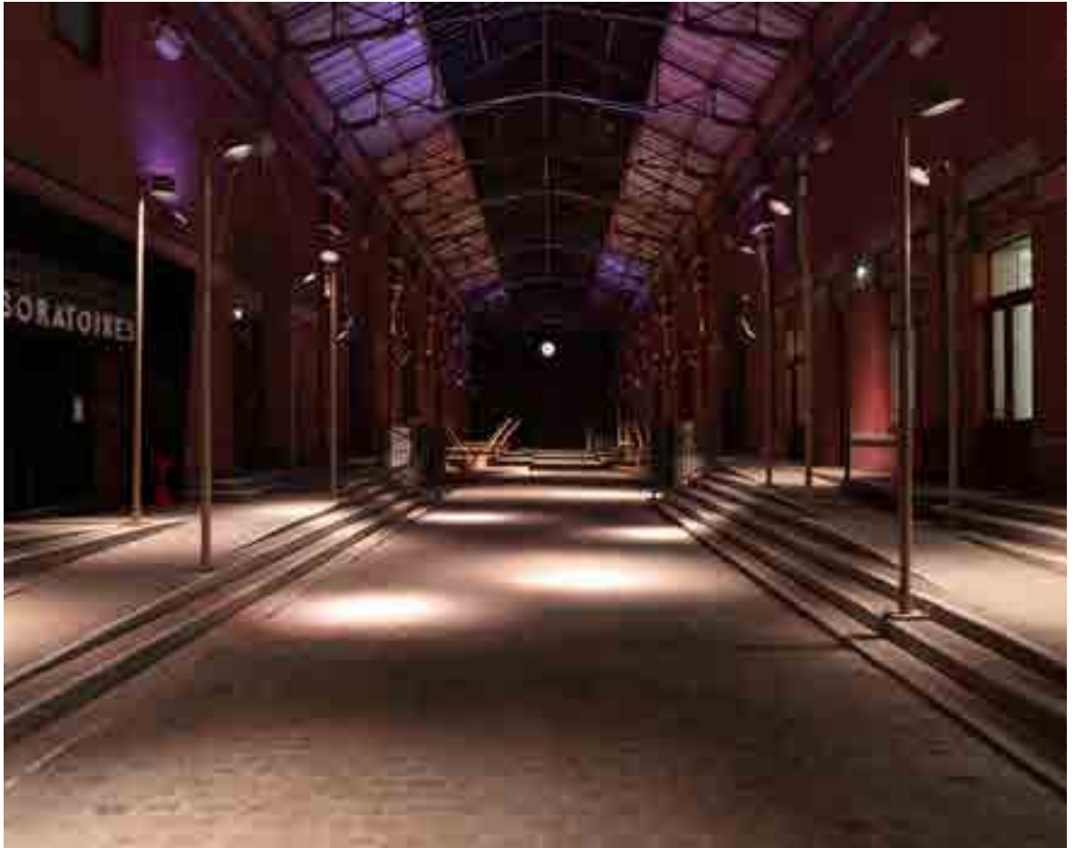
Photographie de la rue couverte de la Condition Publique de Roubaix totalement rénovée en 2021