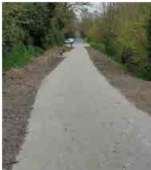
Photographies avant et après la rénovation complète d'un cheminement le long du Canal de Seclin