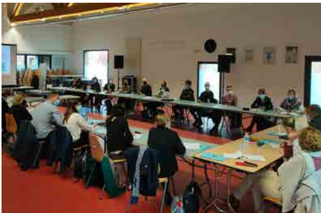
Photographie de la réunion du réseau des référents communaux à Seclin fin 2021