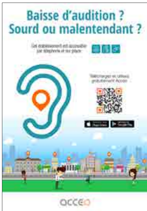
Affiche du service ACCEO

le nombre d'appels passés via ACCEO sur l'ensemble du territoire en 2021.