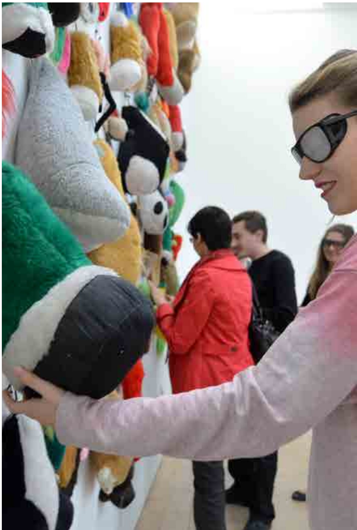
Photographie de la visite guidée pour personnes déficientes visuelles et non voyants, Musée du LaM de Villeneuve d'Ascq