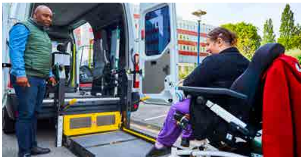
Photographie du service de transport en commun adapté mis en place par Ilevia