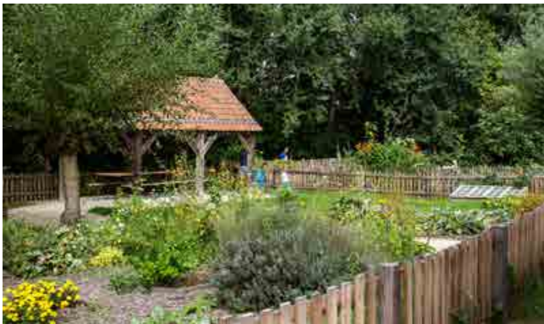
Illustration du projet de réhabilitation du jardin d'animation du Musée de Plein Air

Depuis juin 2020, ce jardin peut désormais accueillir des personnes à mobilité réduite pour des animations.