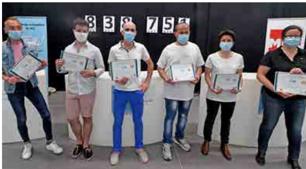
Photographie de la soirée de clôture du challenge de 2021

En 2021, l'équipe qui a réalisé le plus de kilomètres toutes catégories confondues est celle des Papillons Blancs de Lille avec un total de 27 009 km accomplis.