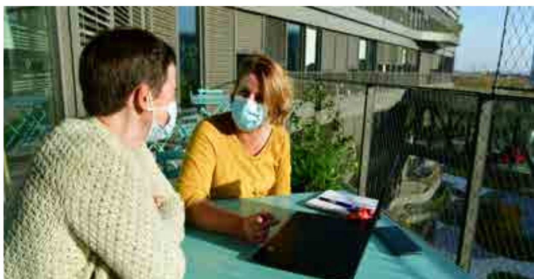
Photographies montrant deux binômes du Duo Day 2021 à la MEL